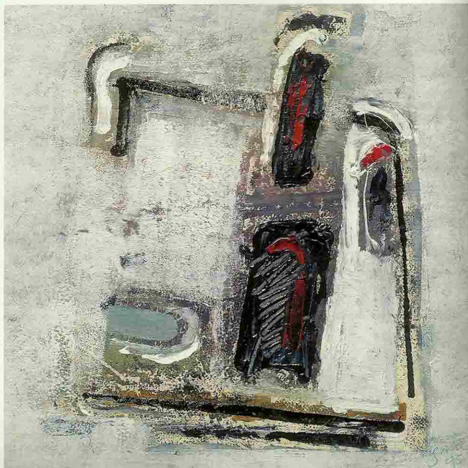
▲ Jan Radersma: Didjalan II, 1997; gemengde techniek, 53 x 52 cm