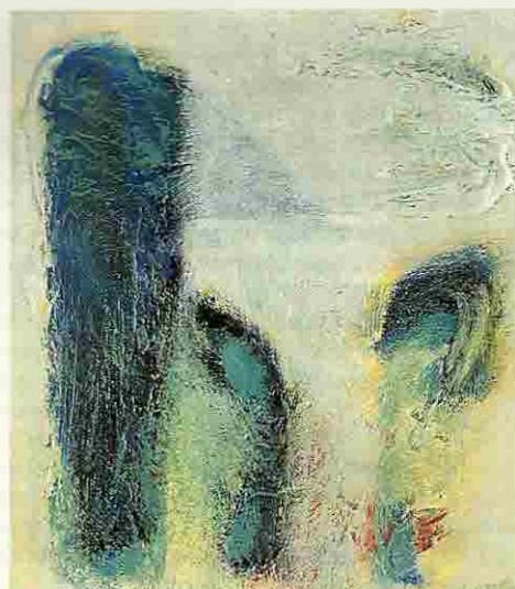
◀ Jan Radersma: Beeldelement, gemengde techniek; 152 x 13 cm