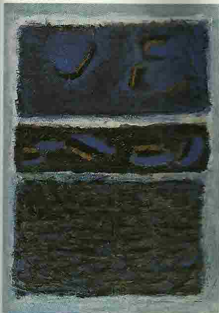
Jan Radersma; 'Retraite', gemengde techniek, 80 x 70 cm ▲