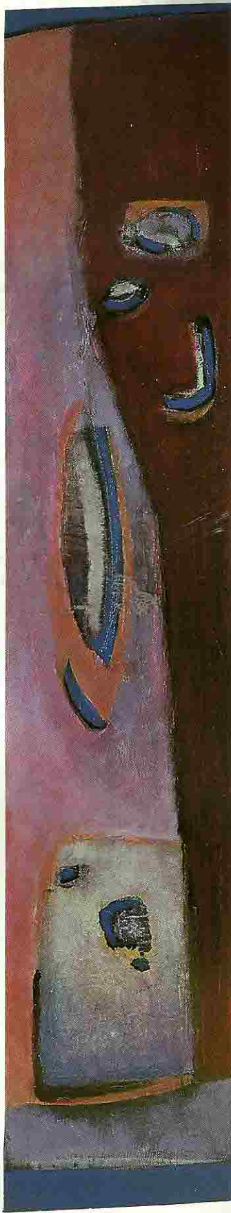
Jan Radersma; 'In de kern uniek', gemengde techniek, 35 x 160 cm.

Geen enkele poging is voor honderd procent geslaagd. Kan en mag dat ook niet zijn, omdat elk schilderij moet laten zien dat er meer is, dat er iets is blijven liggen en dat er daarom logischerwijs